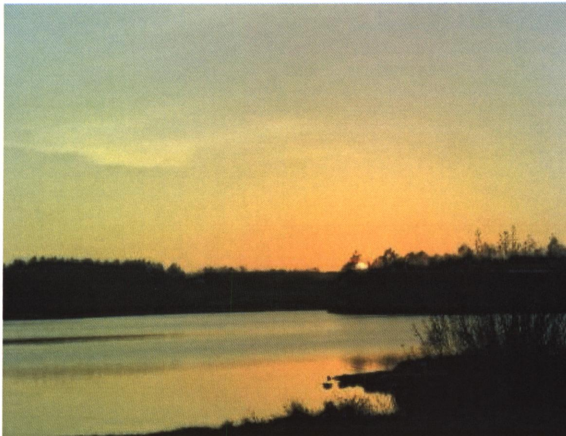
Fot. 1 Widok na Jezioro Gowidlińskie

Największa szerokość to 1,2 km, natomiast maksymalna głębokość – 26,9 m. Od strony zachodniej wrzyna się w jezioro rozgałęziony i zalesiony półwysep o długości 1 km.