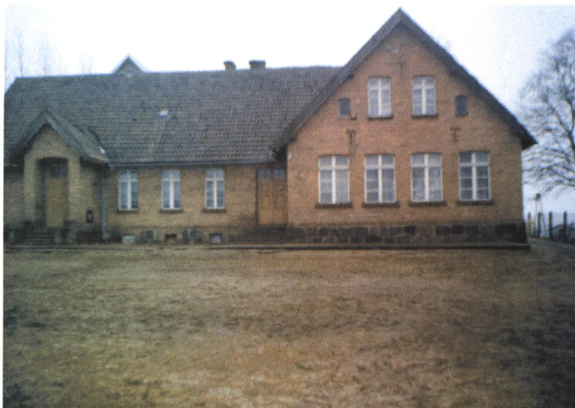
Fot. 3 Budynek szkolny z 1885 roku