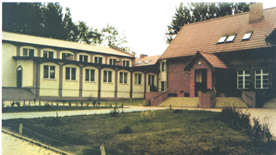
Fot. 5 Odrestaurowany budynek szkolny z 1995 roku oraz sala gimnastyczna z zapleczem z 1998 roku