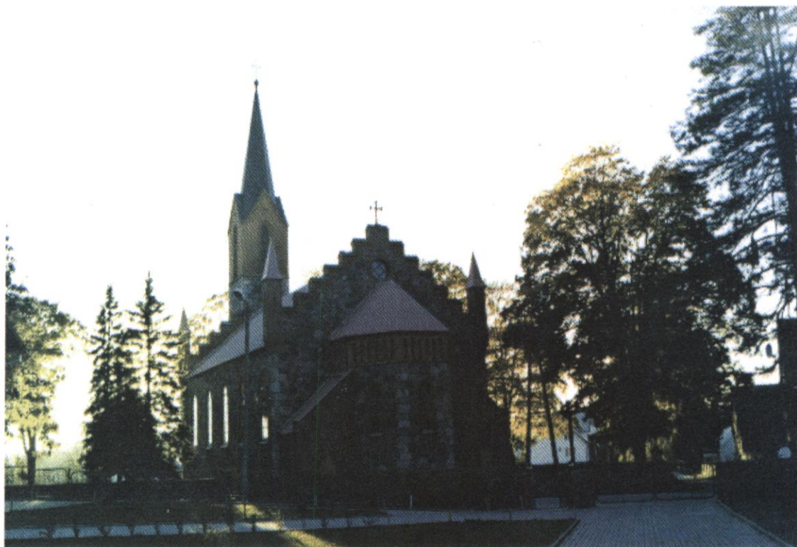
Fot. 4 Kościół parafialny w Gowidlinie pw. NPNMP

bezpośrednio Urzędowi Wojewódzkiemu w Gdańsku. Od 1 stycznia 1999 roku gmina wchodzi do powiatu kartuskiego, który jest częścią województwa pomorskiego.