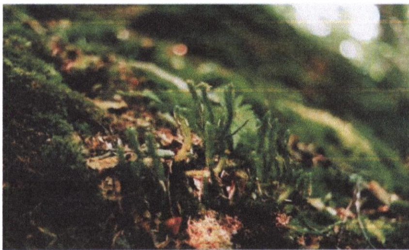
Widłaki stanowiące coraz większą rzadkość

W głębi lasu wchodzącego w skład rezerwatu spotyka się niektóre odmiany widłaków.