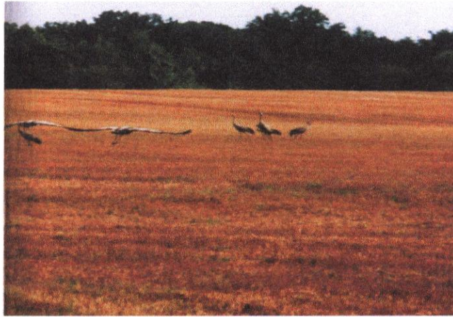
Żurawie na żerowisku

* Punkty widokowe w okolicy Mojuszewskiej Huty i Mojusza. Ukształtowanie powierzchni na tym terenie jest bardzo zróżnicowane. Najwyżej wzniesione tereny to obszary zajmujące południowo-wschodnią i wschodnią część gminy, czyli właśnie okolice Mojusza i Mojuszewskiej Huty. W kilku miejscach wysokości terenu przekraczają 260 m n.p.m. Najwyższe wzniesienie o wysokości 270,5 metra znajduje się w Mojuszewskiej Hucie. Nieco niżej posadowiony jest punkt triangulacyjny w Mojuszu (269 m n.p.m.). Wzniesienia są wynikiem procesów glacialnych. Lodowiec pozostawił na terenie obecnej gminy Sierakowice przeróżne formy. Jest tu falista wysoczyzna moreny dennej zwana Mojuszewsko-Mirachowską; są pagórki czołowomorenowe (Pagóry Sierakowickie); pomiędzy nimi występują liczne wytopiska zajęte przez jeziora i torfowiska. Na północnych krańcach, w nieckach wytopiskowych, ulokowane są moreny martwego lodu, kemy, piaszczyste pola sandrowe. Wysoczyzny są rozcięte polodowcowymi rynnami ( największa rynna Jeziora Gowidlińskiego), które mają typowy kierunek z północy na południe.