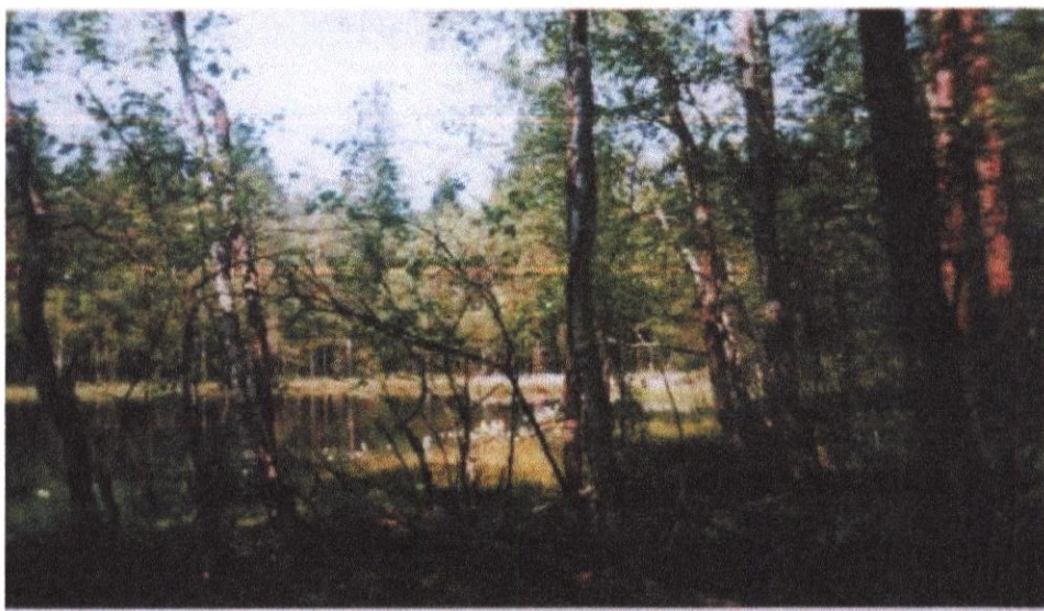
Nad brzegiem „Czarnego Jeziorka”

* Rezerwat „Żurawie Chrusty” - (21,82 ha), torfowiskowy rezerwat, obejmujący śródleśne „Czarne Jeziorko” o dystroficznym charakterze, otoczone torfowiskiem przejściowym z tendencją do zarastania.