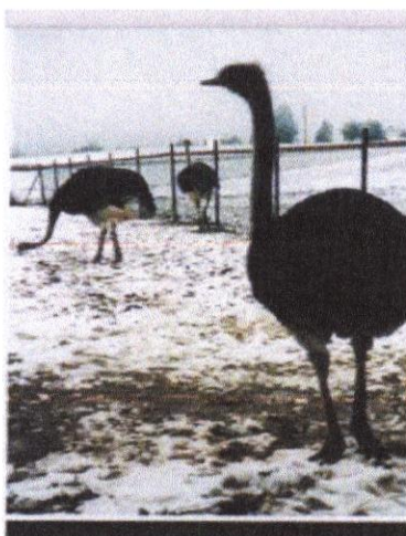
Strusie rodem z Mojusza

wsi lub w większych miejscowościach takich jak Kartuzy, Lębork, Wejherowo bądź w Trójmieście. Niektórzy mają całkiem ciekawe pomysły realizowania własnego hobby, co też może być niezłym chwytem marketingowym i zapleczem edukacyjnym dla szkoły. Mowa o fermie strusi, które można obejrzeć nie ruszając się z miejsca.