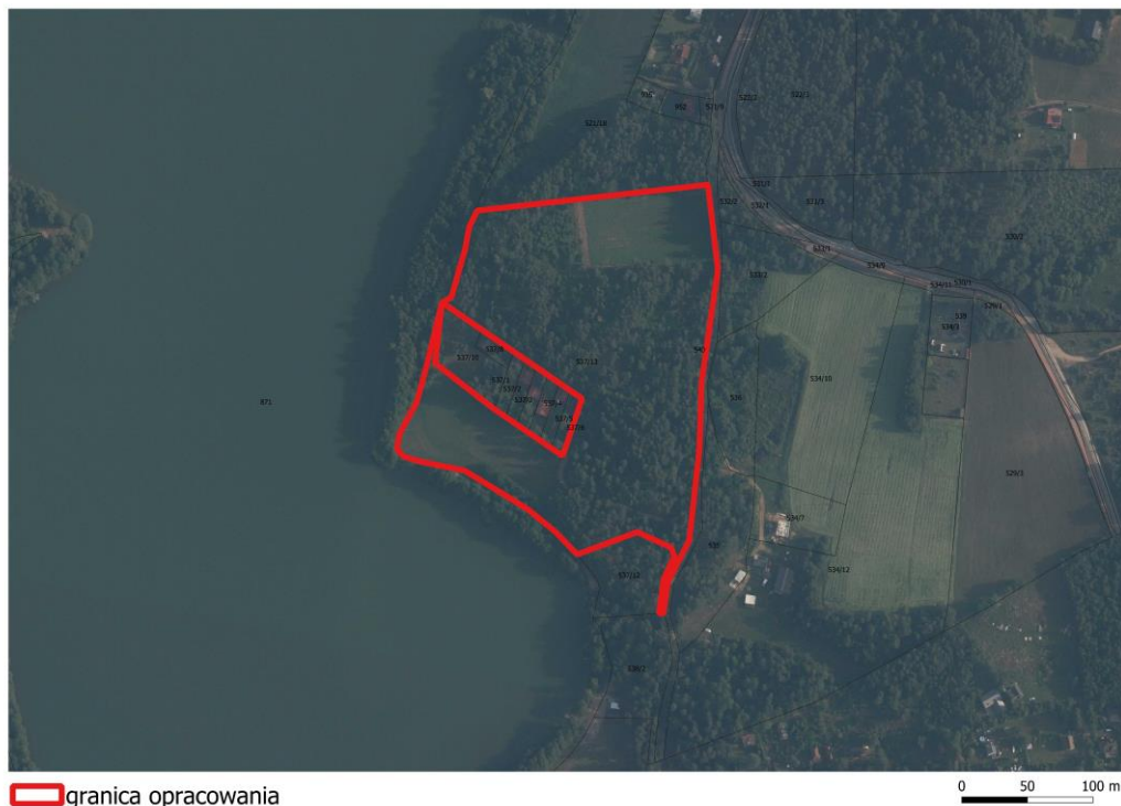
Rys. 3. Obszar opracowania na tle fragmentu miejscowości Gowidlino - ortofotomapa