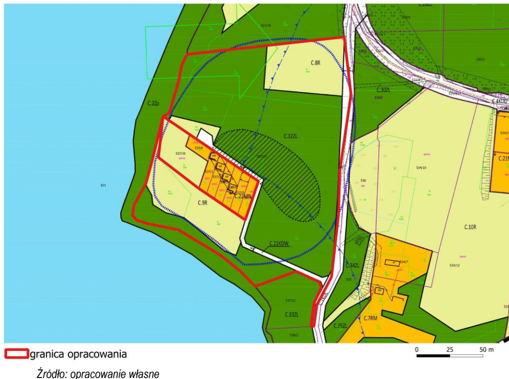
Rys. 5. Obszar opracowania na tle podstawowej wersji prognozy oddziaływania na środowisko wraz z ustaleniami planistycznymi (2021 r.)