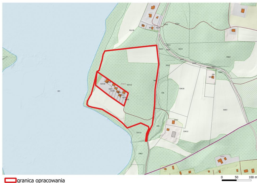
Rys. 2. Obszar opracowania na tle fragmentu miejscowości Gowidlino