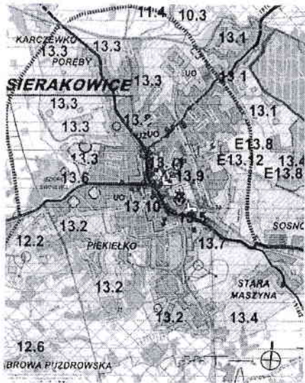
FRAGMENT OBRĘBU SIERAKOWICE, SKALA 1:10 000